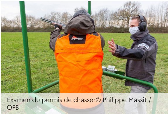
Examen du permis de chasser